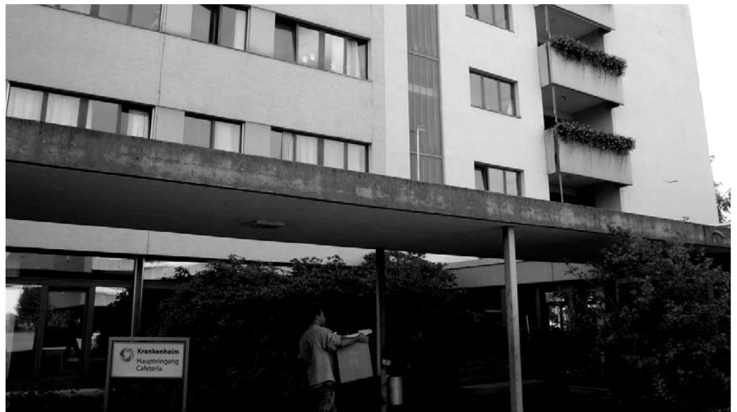
Die Sanierung und der Umbau des Krankenhauses «Im Grund» ist unumgänglich.

Eine absolute Notwendigkeit: Die Bewohnerinnen- und Bewohnerzimmer sind für heutige Massstäbe eng und düster. Nasszellen sind Mangelware und meist nur mühsam über den Flur zugänglich. Aufgrund der demographischen Veränderungen in der Schweiz beherbergen Pflegeheime heutzutage vor allem sehr alte, polymorbide Menschen, Menschen also, die sich in der vierten Lebensphase (80 Jahre und älter) befinden und mehrfach erkrankt sind. Diese Bewohnerinnen und Bewohner benötigen zunehmend pflegerische Unterstützung in