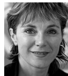
Maja Graf, Grüne Nationalrätin BL

«Ich finde es bewundernswert wie Chantal Galladé ihre politische Arbeit mit ihrer Aufgabe als junge Mutter kombiniert. Auch wenn Chantal und ich politisch oft unterschiedlicher Meinung sind, können wir zusammen lachen. Mit Chantal kann man (sprichwörtlich ausgedrückt) Pferde stehlen. Ihre offene und humorvolle Art schätze ich sehr.»