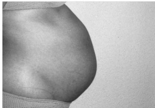
Alle Kinder sollen einen guten Start haben.

Ja zur Mutterschaftsversicherung am 26. September 2004.