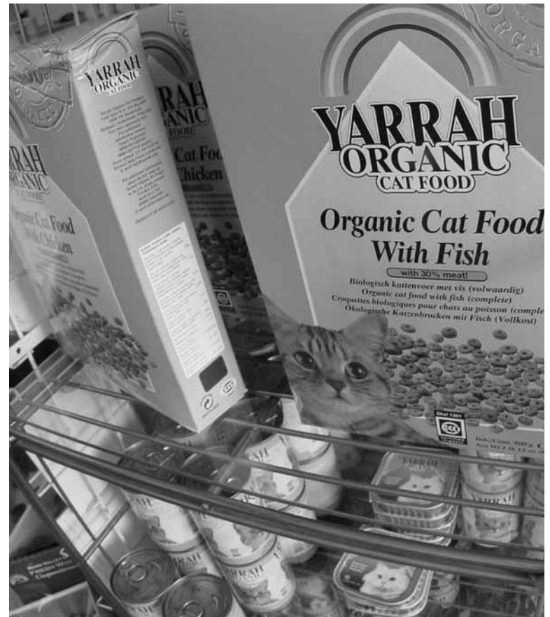
Keine Angst vor wilden Tieren.

8 Prozent der Aktien sind für das Personal reserviert und können zu einem symbolischen Preis gekauft werden. Mit diesen Aktien übt das Per-