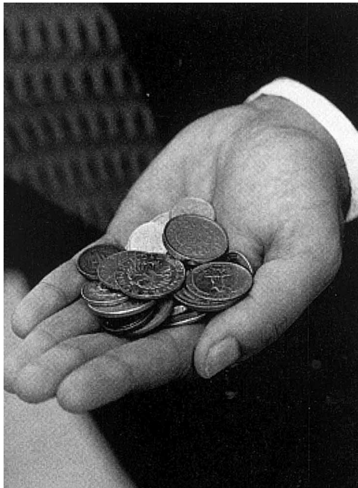
Beim Raubzug auf die Gemeindekassen bleibt es nicht bei ein paar Münzen: Die Stadt Uster verliert Steuereinnahmen von zwischen 5,4 Mio. und 6,7 Mio. Franken.

Bei diesen Zahlen erstaunt es nicht, dass auch in der Stadt Uster ein Sparpaket droht. Durchgehende Blockzeiten, die Einführung von flächendeckenden Tempo 30-Zonen oder ein weiterer Ausbau der familienergänzenden Betreuung können die Ustermerinnen und Ustermer dann schlicht vergessen. Und dies alles wegen eines Steuergeschenkens an die HauseigentümerInnen? Da gibt es nur eine Antwort: Nein zur egoistischen Hauseigentümer-Initiative!